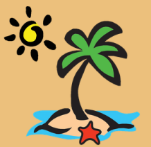
Tabla de Reclutamiento para Respiro