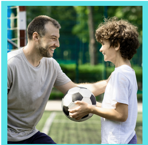
OXNARD PORT HUENEME